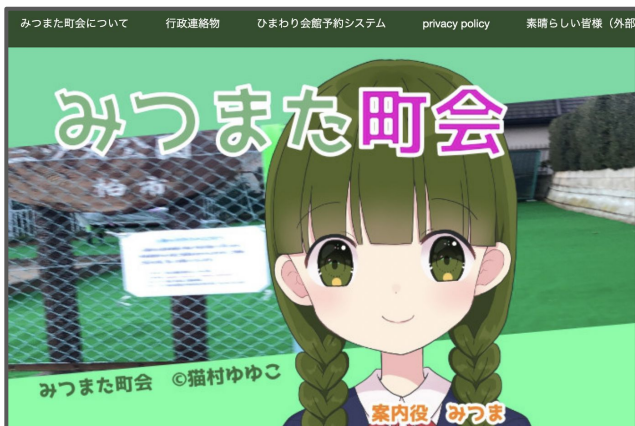
三俣町会ホームページ